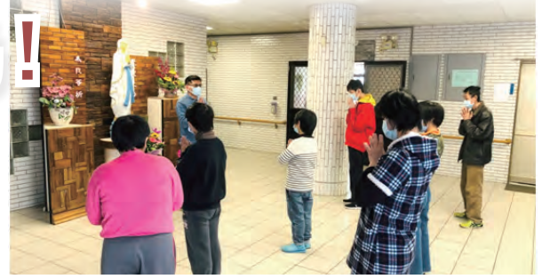
▲感謝天主，感謝聖母媽媽，感謝所有恩人，聽到我們的祈求，讓樹苗順利完銷。

未來，華光除了持續教育、訓練服務使用者培育小樹苗外，還計畫再增加多肉植物的種苗繁殖、防疫手工皂的製作等，努力提供多元課