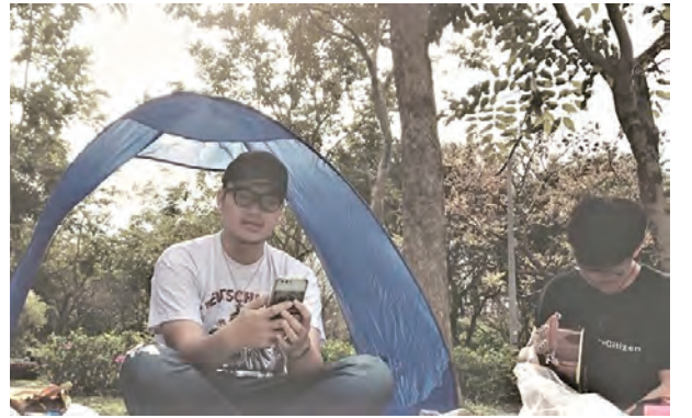
▲青年朋友在大自然下舉行聖道禮儀，並神領聖體。 ◀疫情期間，青年們以徒步朝聖來與天主相遇囉！

疫情期間，許多防疫措施看似減少了進堂次數，但是此刻我們的相信、盼望、信心卻隨著復活的主耶穌而更新，我們的信仰在復活期教導我們，不只看耶穌的跌倒、受難與聖死，而是更要望向三日後從死者中復活的主，這信德帶給我們相信、盼望及信心。青年們面對這段期間可以試著把目光放高、放遠，看向疫情過後即將再復興起來的教會，也將這目光化成我們的目標。那麼，我們能做些什麼好幫助自己更看向未來呢？