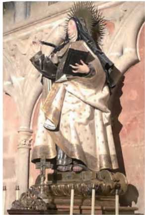
▲Leon主教座堂中大德蘭 ▲歡樂山