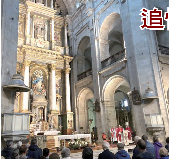
▲聖城的朝聖者彌撒