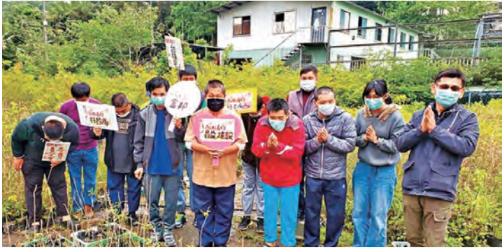
▲華光智能發展中心感謝各界善心人士播下善的種子，將愛傳出去。