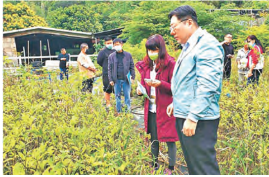
▲昌益建設朱總經理（右）看到媒體報導，親自帶著綠化部門的主管到澤溪農場購買大量樹苗。