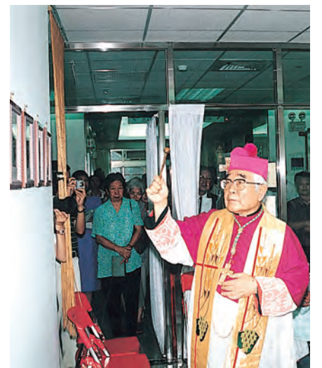
▲狄剛總主教祝聖關渡榮民醫院祈禱室