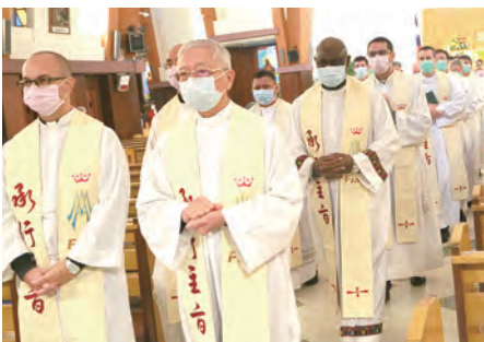
▲神長全戴口罩參禮，形成難忘的復活主日。

呂神父指出，在這疫情中，很多基督徒都在問：這是天主的旨意嗎？是天主的懲罰嗎？天主有什麼計畫？沒有人會知道。但相信「是為叫天主的工作，在這疫情上顯揚出來。」「顯揚出來」的是提醒