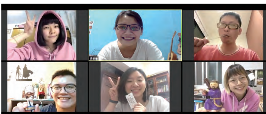
▲雖然減少群聚，但青年們仍運用視訊保持主內間的關懷及友情。

「彼此相待、要良善、要仁慈，互相寬恕，如同天主在基督內寬恕了你們一樣。」（弗4：