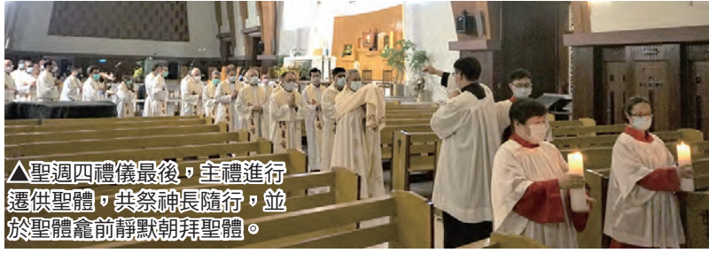
▲聖週四禮儀最後，主禮進行遷供聖體，共祭神長隨行，並於聖體龕前靜默朝拜聖體。