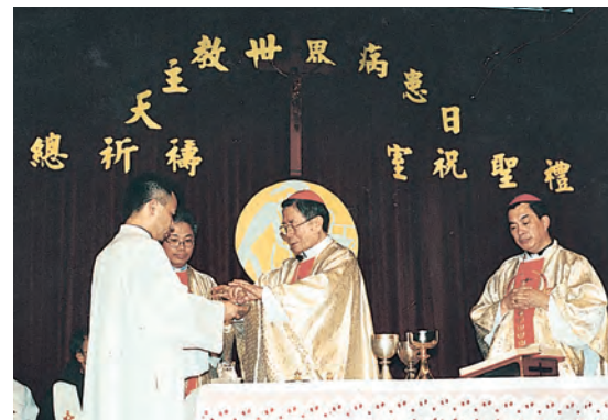
▲單國璽樞機主教主持第9屆世界病患日及祝聖祈禱室

在各教區先後成立祈禱室及小聖堂：台北榮總(1992年6月18日)、石牌振興(1998年4月13日)、內湖三軍總醫院(2001年2月11日)、台北市立