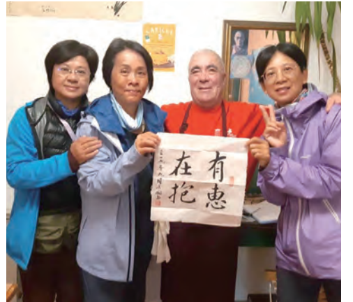
▲老先生經營的庇護所

去年的9月好友邀約我走Camino朝聖之路，她的夥伴都是登百岳高手，而我向來就是四體不勤，為了成行美夢，每天早睡早起，忍着身體疼痛，背起背包跟著大夥兒一起去爬山；也為了增強體能，我開始注意飲食。10個月來，我練習看國外地圖，練習在網上買車票，這樣開始翻轉生活。聽背包的重量只能有體重的10分之一，得慎選每件衣物的功能達到最大化，也是個「斷捨離」的操練。第1次出國，就走這麼遠的路程，是盲目的勇敢？還是天主的恩寵？我不在乎眾多疑慮，傻乎乎地，把這些都放在祈禱之中。