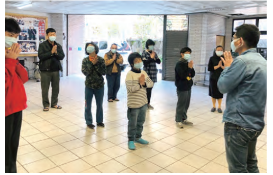
▲華光智能發展中心師生在晨禱中祈求天主，願疫情早日平息，也祈求天主，願我們的恩人平安。