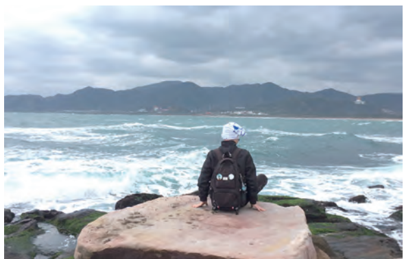
▲非常時期也是個轉機，默想中，在一切事上去發現天主。

讓耶穌做我們生命中的主，這是最重要的！這段期間也是增加我們信德厚度的機會，我們需要去相信轉變一定會發生，我們需要更有期盼的信德，相信雨後會有天晴，特別這時候，我們的心態與行動力更形重要，在這看似低靡的氣氛下，是否更能讓人看出我們是基督徒，基督徒在面對這樣的情況會用溫和又有創意的方式繼續去傳遞希望跟愛，青年們也更善於運用網路媒體去分享、去傳播，這樣的時期，我們也有更多時間與家人在一起，甚至與家人和好，接受並善用這段時間，這也是順服天主的時間表，我們清楚知道人的渺小，而天主會去完成工作。